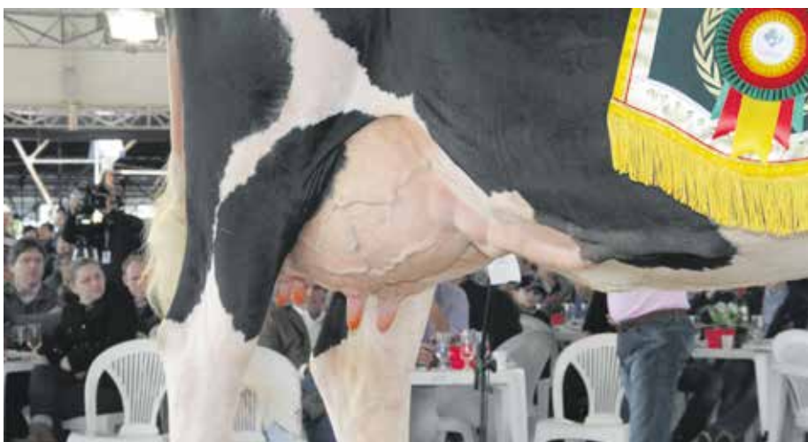
Genética gaúcha foi valorizada na pista de Leilão