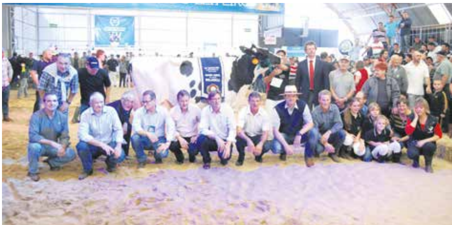
Criadores festejaram o grande campeonato

A ExpoClara tem por objetivo dar a oportunidade aos seus associados de seus animais serem avaliados e comparados aos de outros produtores, podendo ainda trocar experiências e valorizar seus rebanhos. O evento é uma vitrine para o trabalho de melhoramento genético desenvolvido pela Santa Clara em parceria com seus produtores associados.