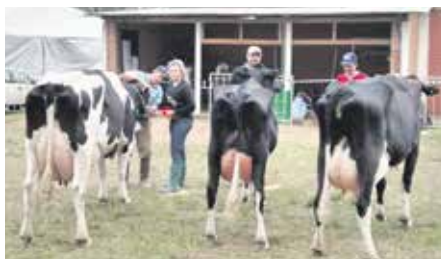
As três melhores da Expo São Pedro do Sul