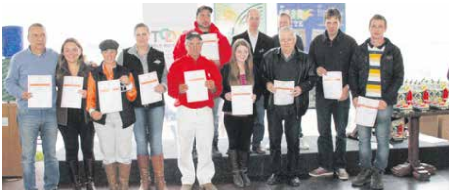
Destaque premiou as melhores posições de 2014 em vários segmentos

do ano anterior. A Gadolando também instituiu os Destaques Especiais que são Empresa Parceira, em Melhoramento, Reconhecimento por Serviços Prestados, Imprensa e Político.