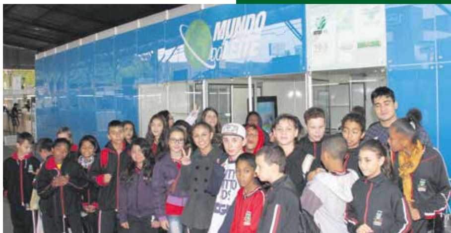
Mundo do Leite foi atração com foco nos jovens

SISTEMA FARSUL, FEBRAC, FETAG, APIL, SIMVET, FAMURS E SILOS GAÚCHOS