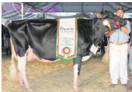
Terceira melhor saiu para Salvador do Sul