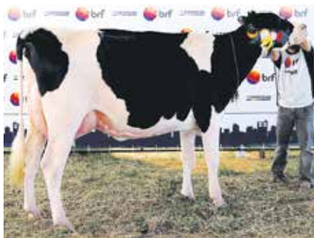
Bickel Laurinha foi a grande campeã em Três de Maio

A raça Holandesa participou na 11ª Exposição de Gado Leiteiro com 51 animais de 10 expositores gaúchos. Ao redor da pista de julgamento do Parque de Exposições Germano Dockhorn foi possível constatar o interesse que o segmento leite e consequentemente a raça Holandês vem incrementando. A plateia foi formada por produtores, técnicos