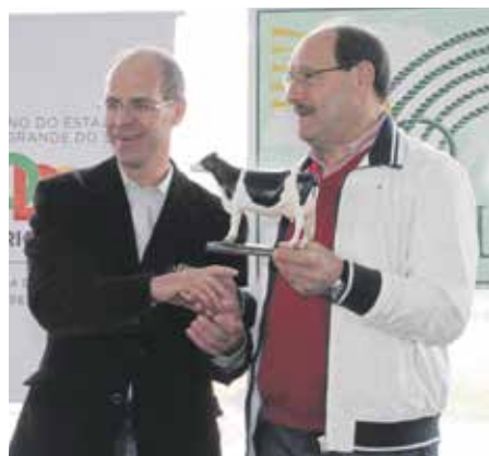
Gadolando homenageou Governador Sartori

Atualmente a Gadolando na Expoleite Fenasul entrega troféus aos criadores que alcançaram as melhores posições em itens como registros, controles leiteiro, classificações e exposições homologadas no período